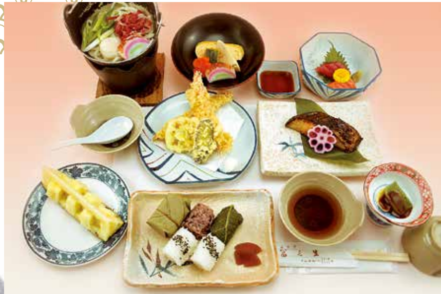
富之里ご膳 3,000円(税別) 柿の葉寿司・めはり寿司・古代米おにぎりが付いた和風ご膳