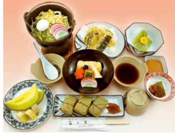
斑鳩(いかるが) 2,000円(税別) 柿の葉寿司が付いた田舎風ご膳