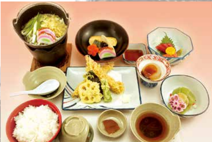
夢殿(ゆめどの) 2,000円(税別) 和風ご膳