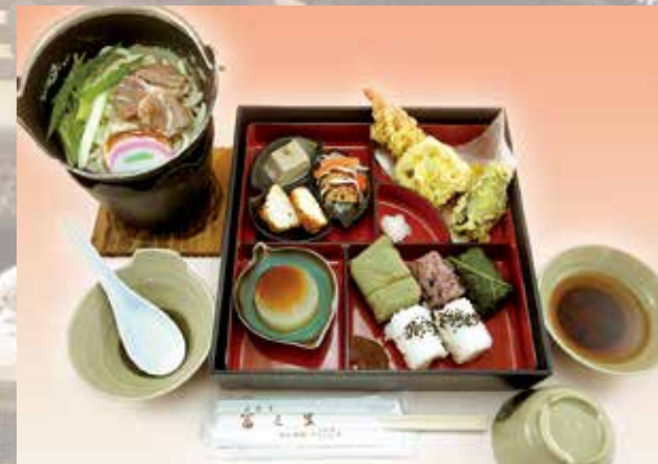
やまと弁当 1,500円(税別) 柿の葉寿司・めはり寿司・古代米おにぎり・大根田楽・ごま豆腐・柿なます・大和肉鶏鍋等 奈良の郷土料理