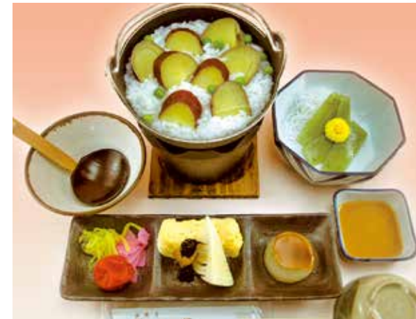
いもがゆ膳 1,200円(税別) さつまいもが入ったおかゆご膳