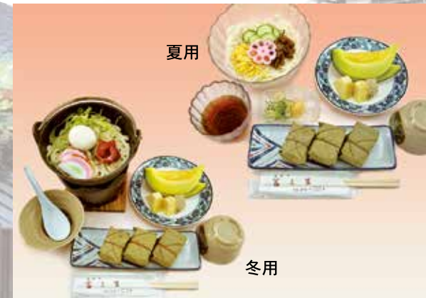
柿の里 1,100円(税別) 柿の葉寿司・麺類・フルーツのセット ※夏用そうめんは6月1日~9月30日まで