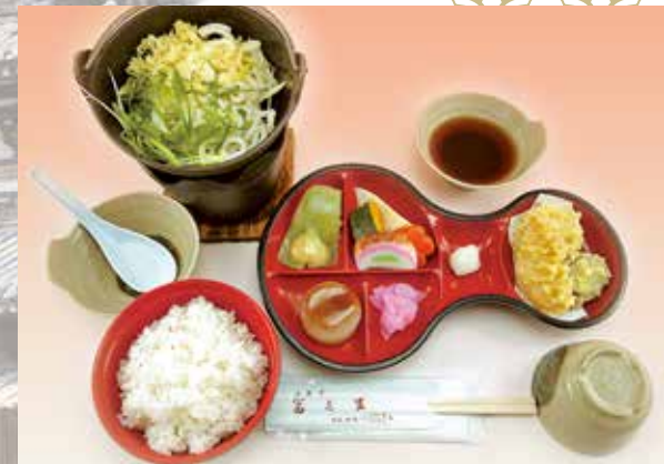
南大門 1,000円(税別) 和風弁当

※ご予算に合わせて、お作り致します。(消費税は別途申し受けます) ※季節により内容が若干変更になるものもございます。