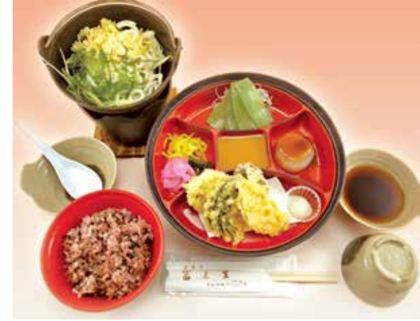
いなかめし 1,000円(税別) 古代米といなか風弁当