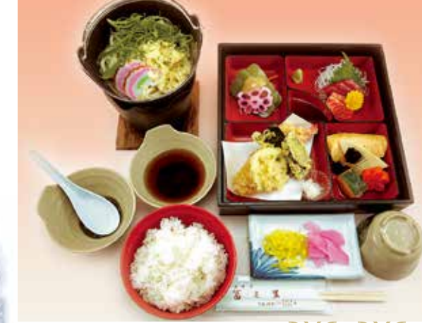
法隆寺 1,500円(税別) 和風幕ノ内